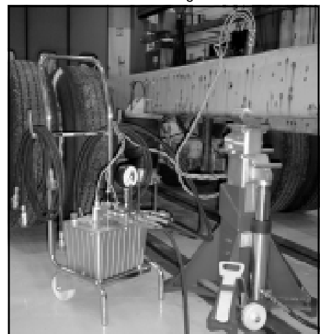
JO LP80 K

Pressione olio: 70 MPa Consumo aria al min: 1,2 l/min a 0 MPa 0,1 l/min a 70 MPa Volume olio: 10 l Pressione aria necessaria: 0,7 MPa Comando: Incluso Uscite: 4 Peso: 42 kg